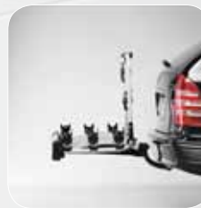
Met het Easy-Slide systeem blijft uw bagageruimte gemakkelijk toegankelijk