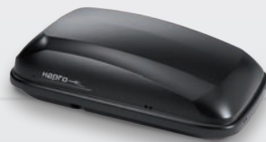
Hapro Roady 350 Mat antraciet L x B x H (cm) 135 x 78 x 40