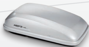
Hapro Roady 350 Mat zilvergrijs L x B x H (cm) 135 x 78 x 40