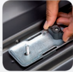
Standard-Fit Hapro Roady 350