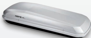
Hapro Roady 450 Mat zilvergrijs L x B x H (cm) 192 x 78 x 41