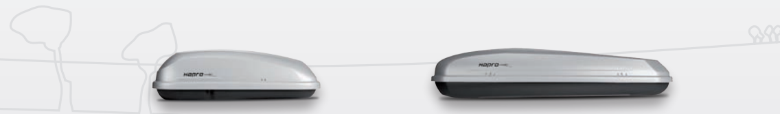
Hapro Roady 350 Mat zilvergrijs L x B x H (cm) 135 x 78 x 40

U zal er van staan te kijken wat er allemaal mee moet op reis. Het is geen pretje als het proppen wordt of thuislaten. Natuurlijk wilt u alles meenemen wat nodig is en dat kan ook. De Hapro Roady is de oplossing. Deze robuuste dakkoffer is de oplossing voor comfortabel reizen met het hele gezin inclusief alle spullen voor een fijn verblijf.