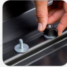
Standard-Fit Hapro Roady 450